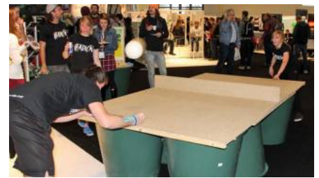
Funsport: Was ist Headis?