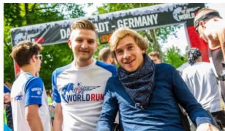
Wings for Life World Run zeitgleich auf sechs Kontinenten