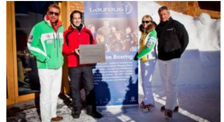
Laureus-Teams sammeln Spenden beim "Weißen Rennen" in Lech Zürs