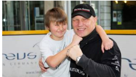
Grillen mit Laureus Botschafter Axel Schulz