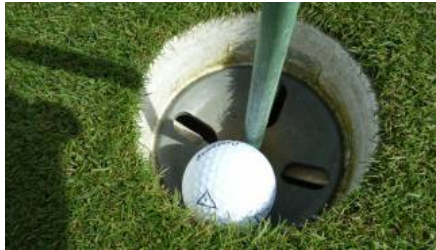
SPORTS MUSIC MEDIA CUP 2012 – Charity-Golfturnier in Pfaffenhofen